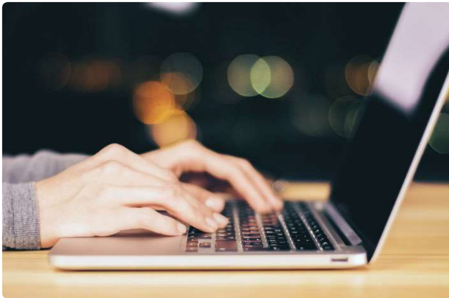
Volwassen NT1'ers voelen zich niet aangesproken als laaggeletterden. Ze hebben geen probleem met spreken en luisteren, maar vertonen soms hiaten op het terrein van lezen en schrijven, rekenen of op digitaal gebied.

herkennen en signaleren van laaggeletterdheid binnen het sociaal domein door professionals (na instructie) is gelukt. Maar uit hetzelfde onderzoek blijkt ook dat er nauwelijks vervolgesprekken zijn gevoerd met laaggeletterden; laat staan dat er daadwerkelijk is doorverwezen. Overigens is dit knelpunt niet voorbehouden aan sociale wijkteams: ook bij bijvoorbeeld leerkrachten, huisartsen, werkgevers en UWV doet zich dit voor. Een derde kanttekening betreft de specificering van de laaggeletterden. De onderzoekers in Drenthe stellen dat de focus scherper gericht moet zijn op specifieke doelgroepen als Nederlandstalige ouderen, jonge moeders en werkzoekenden. Nadere specificering van laaggeletterden is op zich een goede