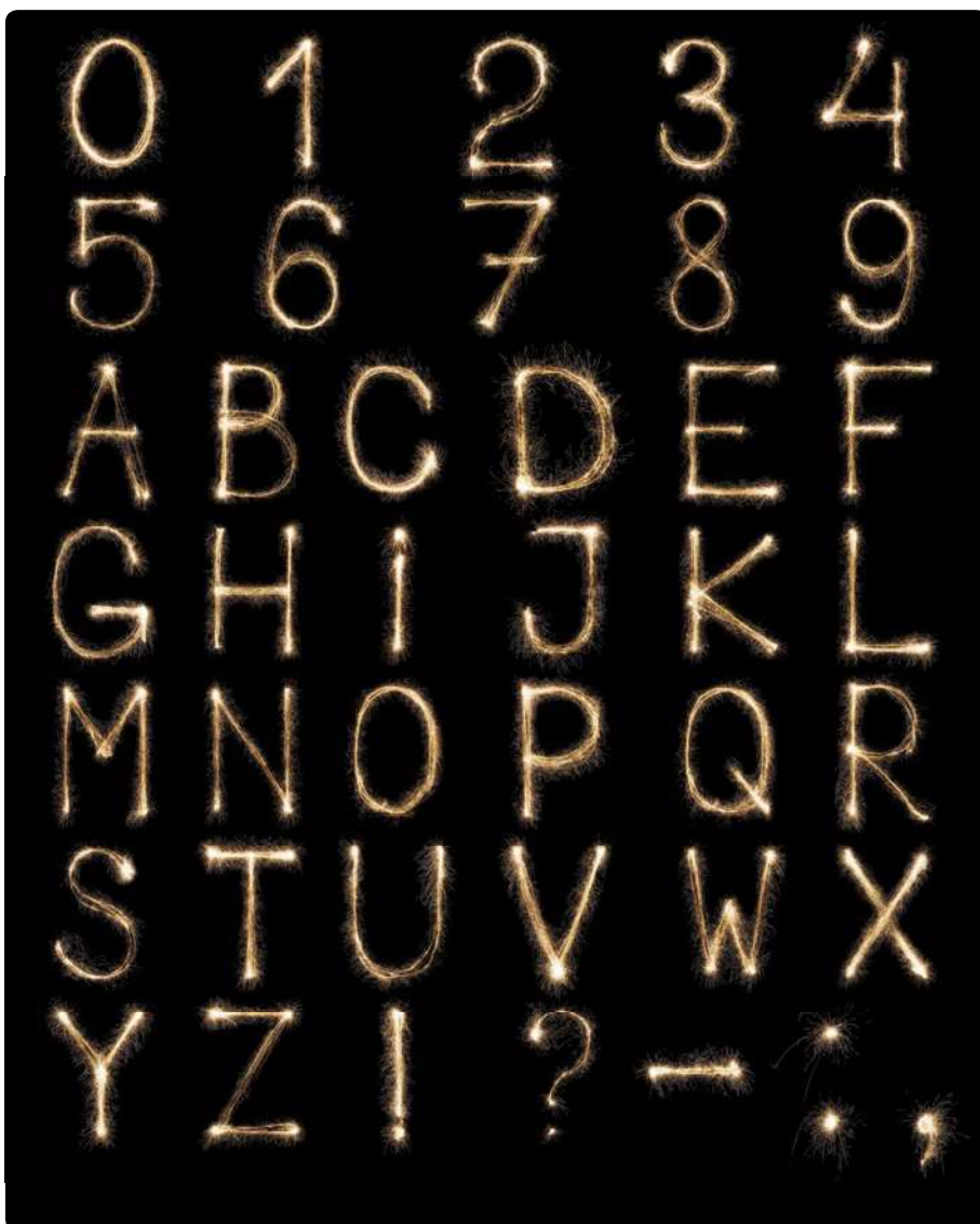
Bij de basisvaardigheden gaat het om taal, rekenen en digitale vaardigheden.

deel van de jongeren laaggeletterd het onderwijs. Het percentage laaggeletterden onder jongeren neemt toe: in 2003 was dat bij vijftienjarigen 11,5 procent; in 2015 was dat 17,9 procent. En dat terwijl het gemiddelde opleidingsniveau van de bevolking de afgelopen vijftig jaar juist fors is gestegen. De kloof tussen hoger en lager opgeleiden wordt steeds dieper. Onder meer door ontzui-ling, individualisering en het lossen worden van (traditionele) sociale verbanden verkeren mensen steeds meer in netwerken van gelijkgestemden. Mensen komen dus minder in aanraking met anders denkenden. Deze ontwikkeling gaat gepaard met het beleidsaccent op zelfredzaamheid. Tjeenk Willink brengt naar voren dat de aannames over de mate van zelfredzaamheid, vaak niet blijken te kloppen. De huidige nadruk op zelfredzaamheid versterkt de